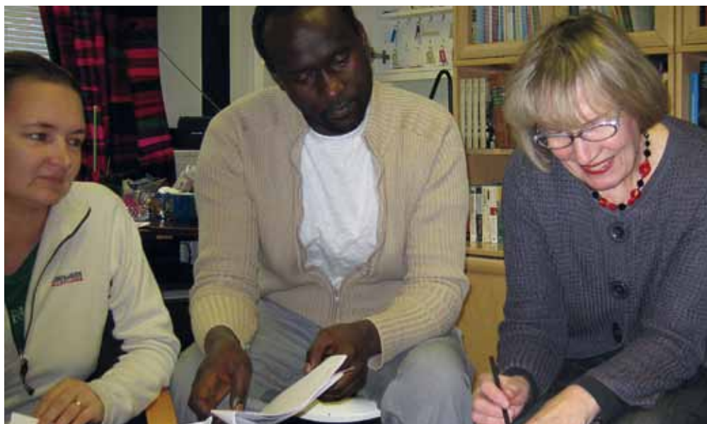
Uutta toimintaa suunnittelemassa.

Asukastalon työntekijät ovat osallistuneet maahanmuuttajien asumisvalmennukseen. He ovat olleet sovittelijoina taloyhtiöiden ja maahanmuuttajaryhmien sisäisissä kiistoissa. Haastattelujen mukaan esim. läskykerhot ja nuorten houkuttelu asukastalolle perustuivat nuorten aiheuttamaan levottomuuteen piholla ja kaduilla. Vanhukset kokivat olonsa turvattomaksi ja lisäksi pihakalusteita sotkettiin ja rikottiin. Nuorten siirryttyä asukastalolle, tilanne rauhoittui. Edellisten lisäksi esimerkkinä nopeasta reagoinnista voisi olla asukastalon jalkautuva vapaaehtoistyö. Asukastalo toimii alueella, jossa eri väestöryhmien palvelutarpeiden harmaita alueita tulee esiin ja näkyväksi. Jalkautuva vapaaehtoistyö on esimerkki arvokkaaksi koetusta toiminnasta, joka