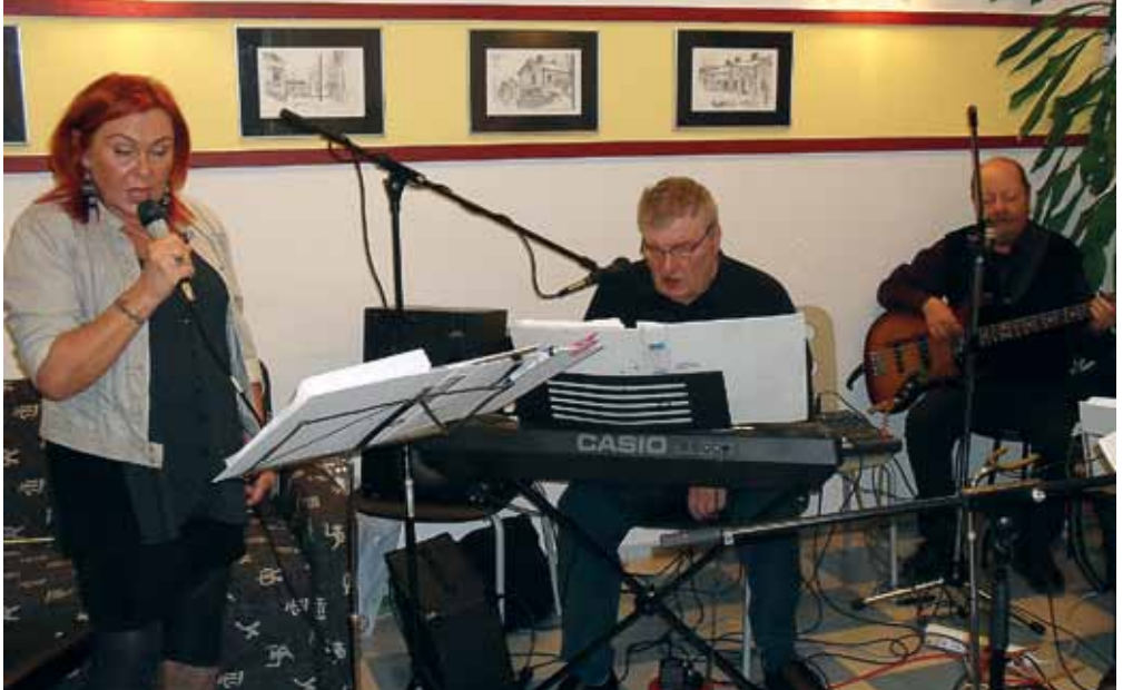
... ja musiikkia.

Erilaiset kertaluonteiset ja toistuvat tapahtumat osoittautuivat tärkeiksi sekä toimintoina että vuorovaikutuksen ja yhdessä tekemisen tuottajina. Aluetapahtumien tarkoituksena oli esitellä erilaisia alueen toimintoja, tuottaa myönteistä Itä-Pasila -kuvaa ja koota alueen asukkaita osallistumaan yhdessä Pasiloiden rajat ylittäen.