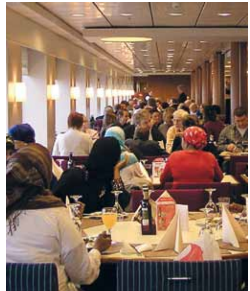
Matkalla Tallinnaan – pasilalaisia kaikki pöydät täynnä.