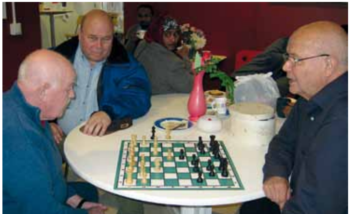
Tietopalaisia ja shakin pelaajia