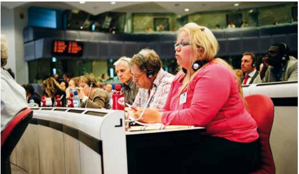
EAPN-Fin:n Pasilan asukastalossa kokoontuneen ryhmän jäsenet välittivät tietoa suomalaisesta köyhyydestä.

Aluetapahtumien ja vuodesta 2009 Pasila-viiikon suunnittelu- ja toimeenpanoryhmän organisoijana ja koolle kutsujana toimi Pasilan asukastalo, jonka lisäksi ryhmään kuuluivat Kalliolan Nuoret ry, Helsingin kaupungin Pasilan sosiaalipalvelutoimisto, leikkipuisto Lehdokki ja asukasyhdistykset ja asukkaat. Yhteistyöverkoston tehtävänä oli aluksi aluetapahtumien järjestäminen, mutta sittemmin se keskittyi koko Pa-