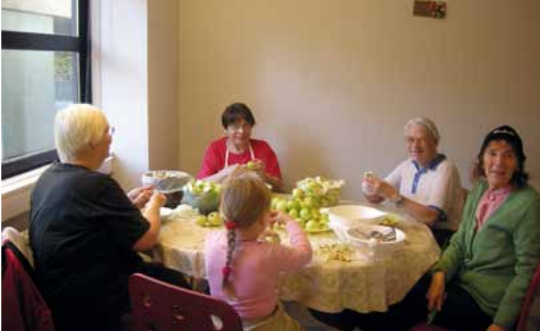
Omenista hilloa tal- koovoimin.

hyvinvoinnin edistäjinä. Tarvetta on paikallisia voimavaroja yhteen kokoavalle organisoitumiselle, toiminnan mahdollisuuksien avaamiselle ja hyvinvointia parantavalle vaikuttamistoiminnalle. Tarkoitus ei kuitenkaan saa olla se, että vastattaviksi kaadetaan ongelmat, jotka ovat syntyneet palveluverkoston haurastuessa sekä yhteiskunnallisen eriarvoisuuden ja köyhyyden kasvaessa tehtyjen yhteiskuntapoliittisten päätösten seurauksena.