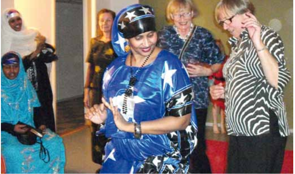
Naisten kesken tanssien.