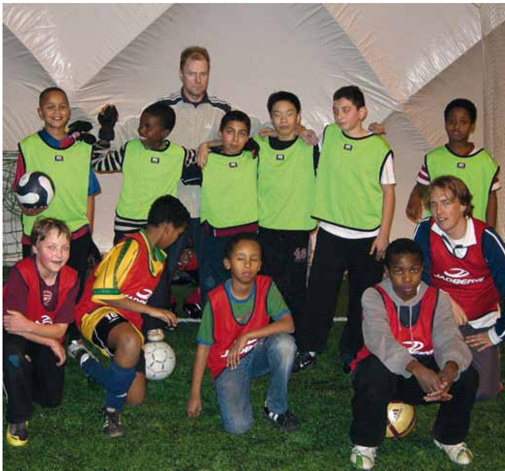
Kalliolan Nuorten jalkapalloilijoita.