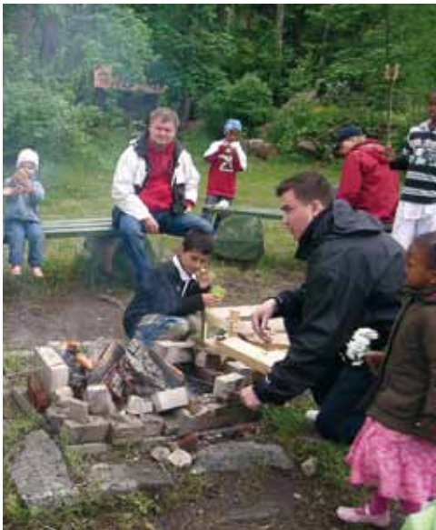
Pasilalaisten perheiden kevätretki Hvitträskiin.

Asukastalosta on tullut tärkeä – henkisesti ja fyysisesti. Varsinkin perjantain keittöpäivät ovat tärkeä sosiaalinen tapahtuma. Joskus keittoon jää sen verran yli, että sitä voi ottaa mukaan. Se on tullut suureen tarpeeseen, kun rahat ovat olleet lopussa. Hän on siitä tyyppinen suomalainen mies, että haluaa pärjätä omillaan ilman julkista apua. Ylpeys ei anna periksi avun pyytämiseen. Asukastalon epävirallinen apu on ollut helpompi ottaa vastaan.